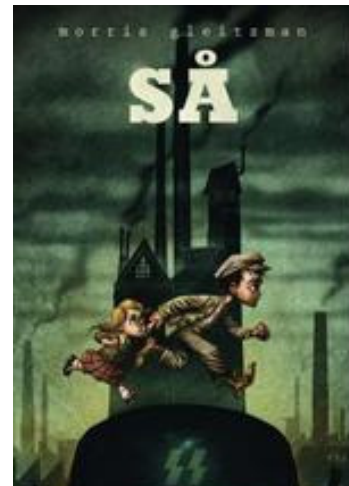
Så er oppfølgeren til En gang, to spenningsromaner for barn om Holocaust, skrevet av Morris Gleitzman.

Så løp vi for livet, jeg og Zelda, opp en bakke så fort vi kunne.