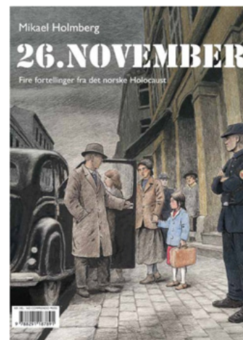
Forsiden av tegneserien 26. november, en tegneserie basert på fire overlevelsesberetninger fra Holocaust i Norge.