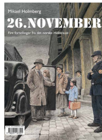
Forsiden av tegneserien 26. november, en tegneserie basert på fire overlevelsesberetninger fra Holocaust i Norge.