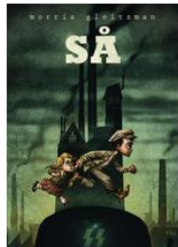
Så er oppfølgeren til En gang, to spenningsromaner for barn om Holocaust, skrevet av Morris Gleitzman.

Oppgaven setter fokus på forskjellen mellom fakta og stemningsskildring, elevene skal bli bevisste på at fakta